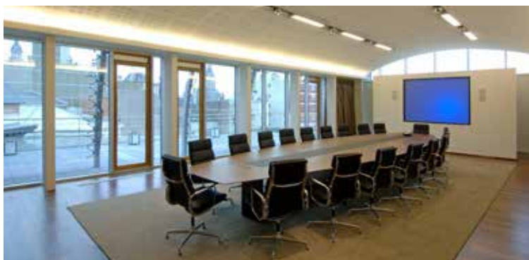
Conseil d'administration - 24 février 2017

Les procès-verbaux des assemblées générales ainsi que les résultats des votes seront mis à disposition sur le site web de la société dans les quinze (15) jours qui suivent l'assemblée générale.